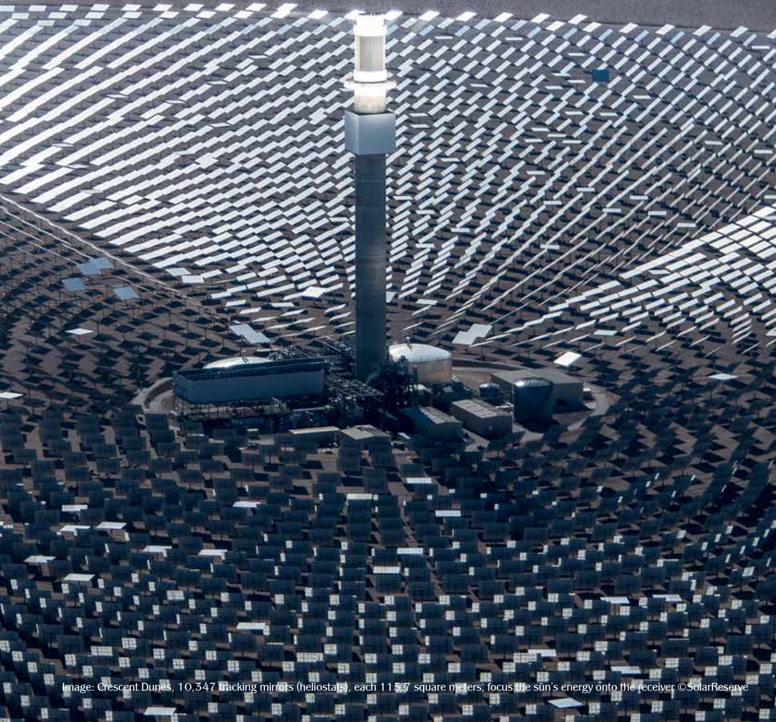
Image: Crescent Dunes, 10,347 tracking mirrors (heliostats), each 115.7 square meters, focus the sun's energy onto the receiver

This type of solar thermal power has an inexhaustible energy source, proven technology performance, and it is environmentally safe. It can be generated in remote deserts and transported to big populations who already have power supply problems. So what are we waiting for?