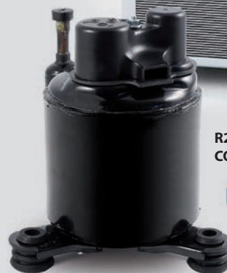
R290 DC INVERTER COMPRESOR ROTATIVO