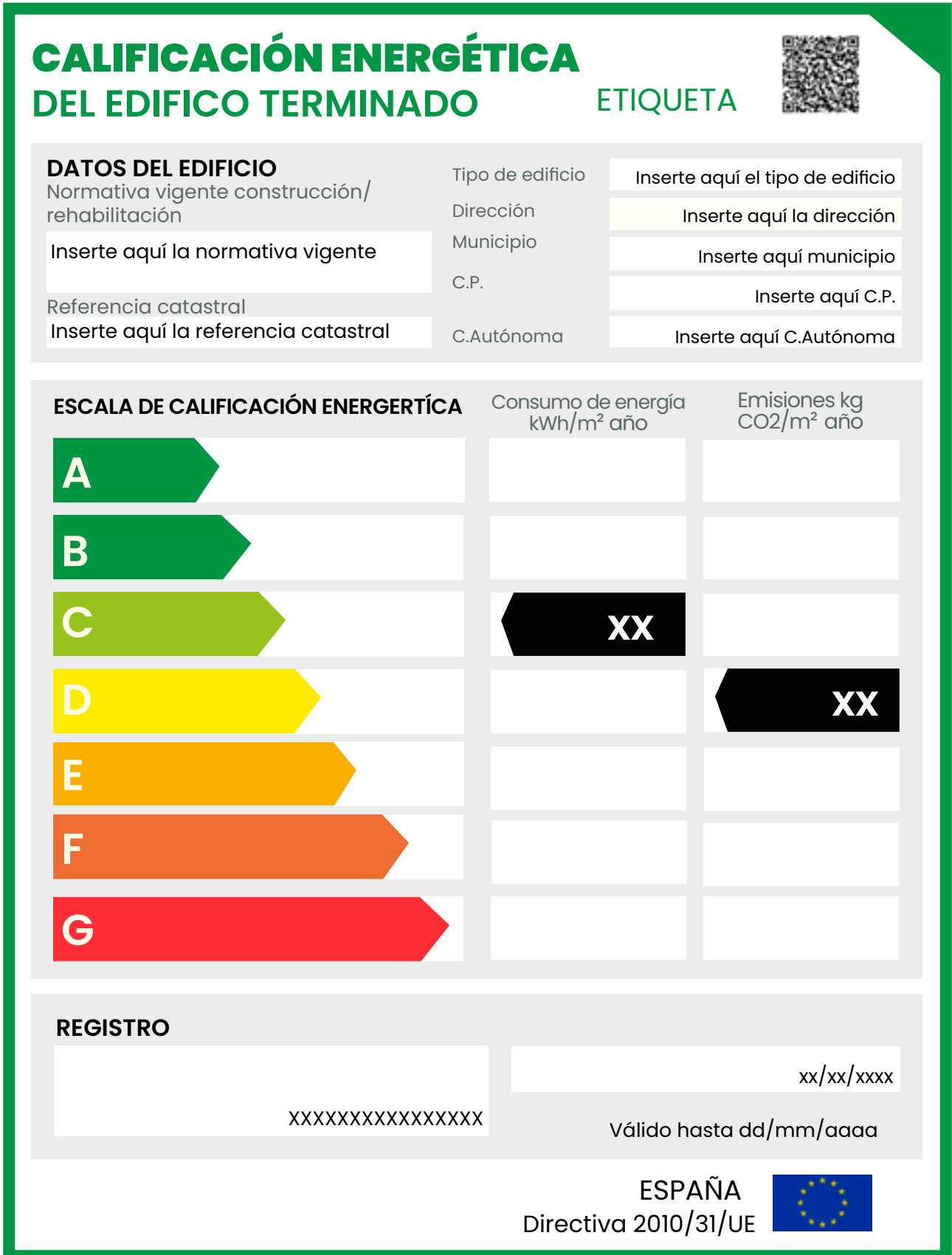
Figura 1. Etiqueta de calificación energética